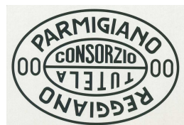
Immagine n. 2